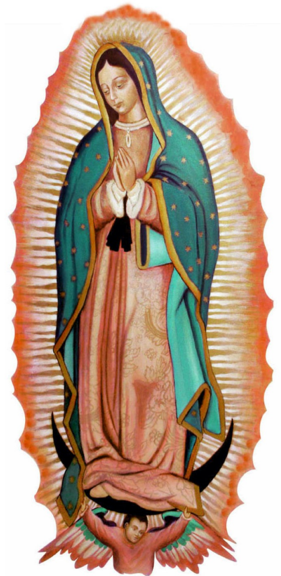
Emperatriz de America

Rosario y Confesiones 6:00pm Santa Misa 6:30pm